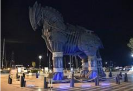
Truva Atı maviye büründü