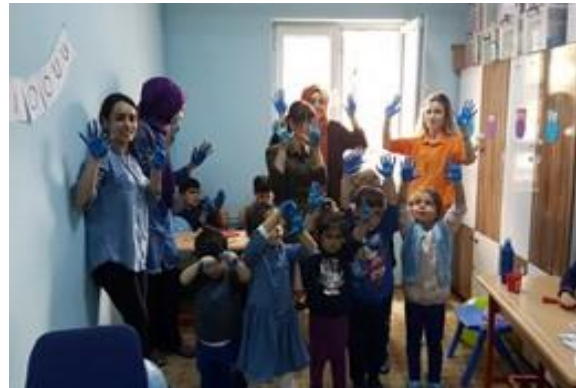
Eller maviye boyandı