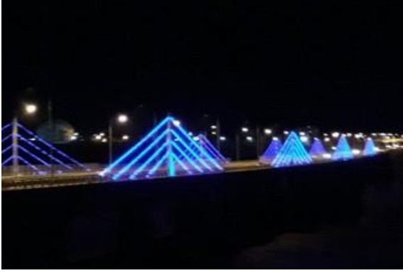
Çapakçur Köprüsü mavi ışıkla aydınlatıldı