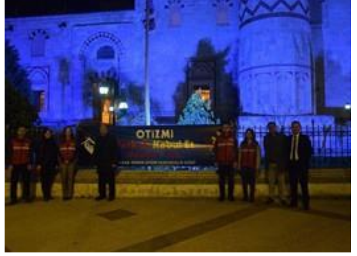
Üç Şerefeli Cami mavi ışıklandırıldı