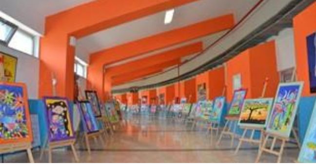
Hasan Doğan Beden Eğitimi Spor Yüksek Okulu öğrencileri ile Mehmet Mescier İş Uygulama Okulu öğrencilerinin katılımıyla karma resim sergisi açılışı yapıldı