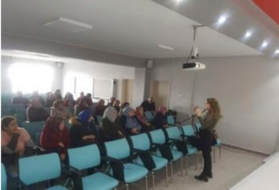
Otizm bilgilendirme toplantısı yapıldı