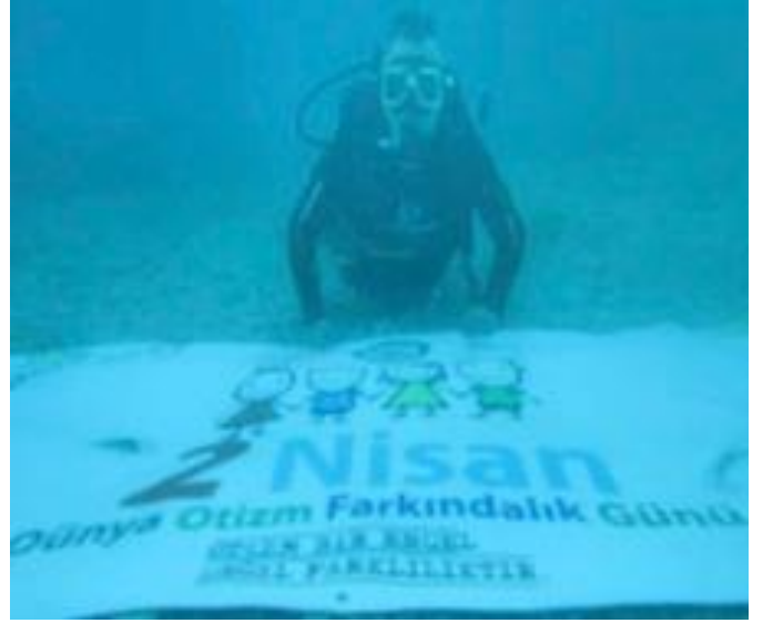
Dalgıçlar tarafından deniz altında pankart açılarak paraşütle atlama etkinliği yapıldı