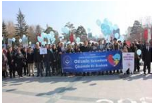
İl protokolü ve Bolu halkı otizm için yürüdü ve gökyüzüne mavi balonlar bırakıldı