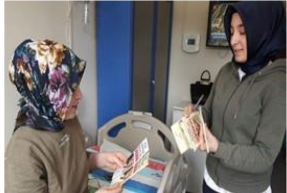
Bayburt Devlet Hastanesi Çocuk Hastalıkları Polikliniğine başvuran ve servislerde yatarak teda- vi alan çocukların ailelerine yönelik bilgilendirme