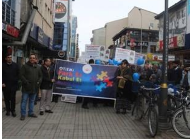
Farkındalık yürüyüşü etkinliği yapıldı