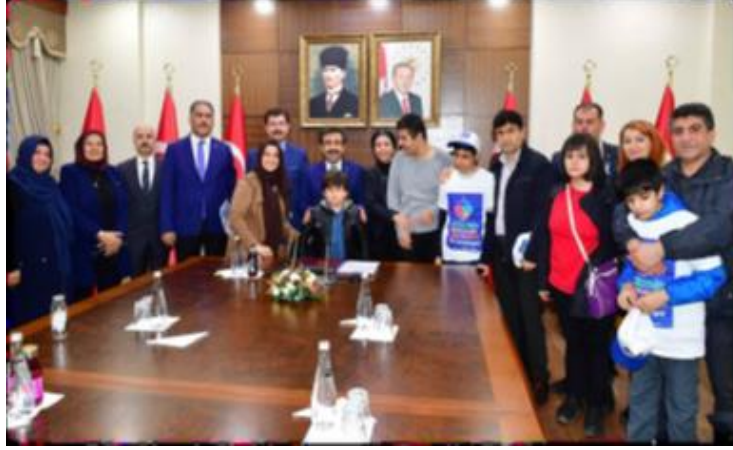
Otizmli çocuklar ve aileleri Sn. Vali Hasan Basri GÜZELOĞLU'nu makamında ziyaret etti