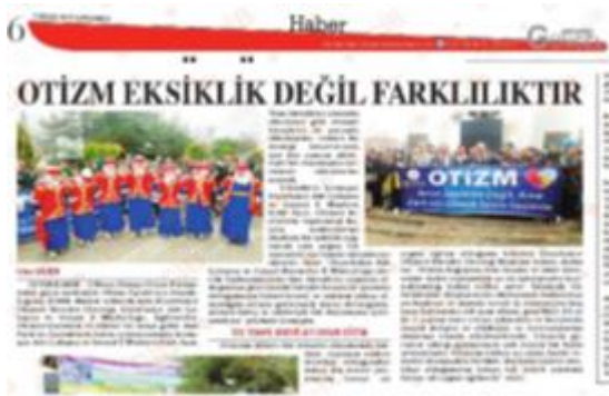
Ulusal ve yerel basında bilgilendirme yayınları yapıldı