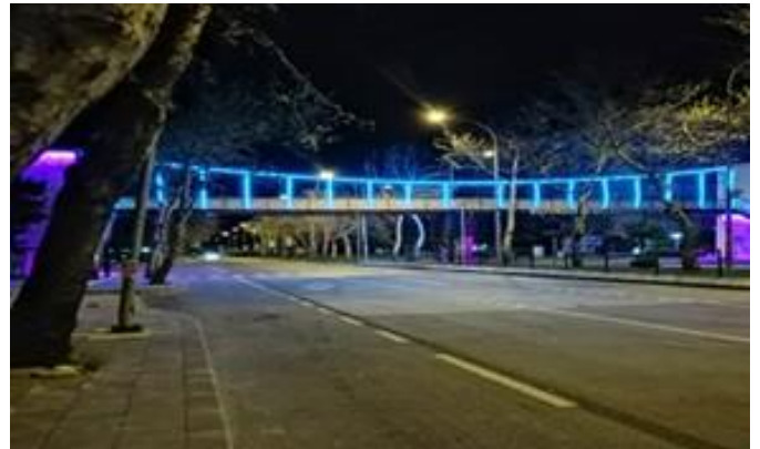
12 Şubat İlçesinde bulunan üstgeçit mavi ışıkla aydınlatıldı