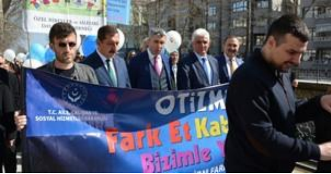
İl protokolü öncülüğünde STK ve halkın katılımıyla farkındalık yürüyüşü yapıldı