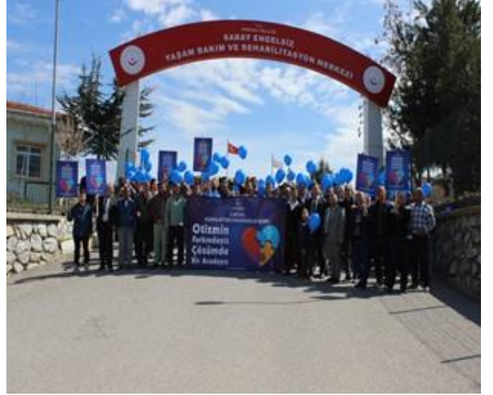
Saray Engelsiz Yaşam Bakım ve Rehabilitasyon Merkezinde 2 Nisan farkındalık etkinlikleri yapıldı