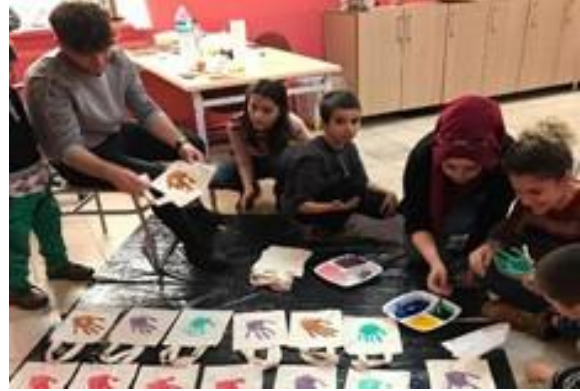
Karaman İl Sağlık Müdürlüğü Okul ziyaretlerinde çocuklarla yapılan etkinlikler