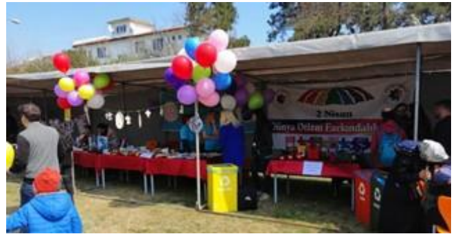
Dingillioğlu Parkı'ndan Festival alanına kadar yürüyüş yapılarak festival alanında stantlar kuruldu