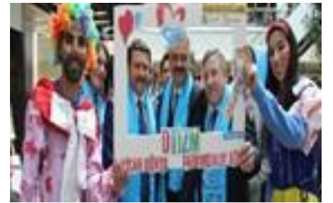
Otizm farkındalığı adına sergi ve etkinlikler tertip edildi