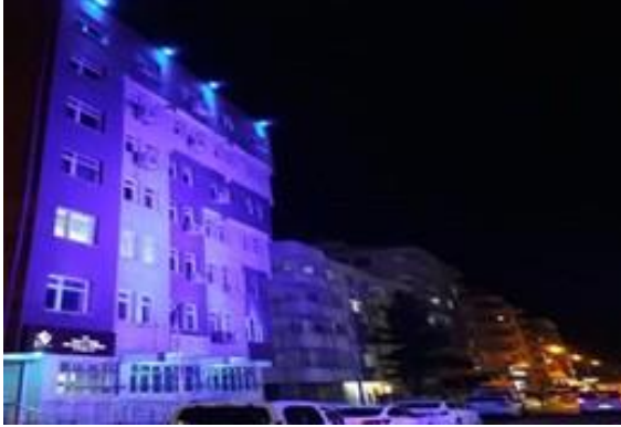
İl Müdürlüğü binamız mavi ışıkla aydınlatıldı