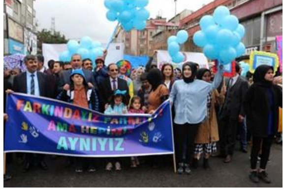
İl protokolü otizm için yürüdü