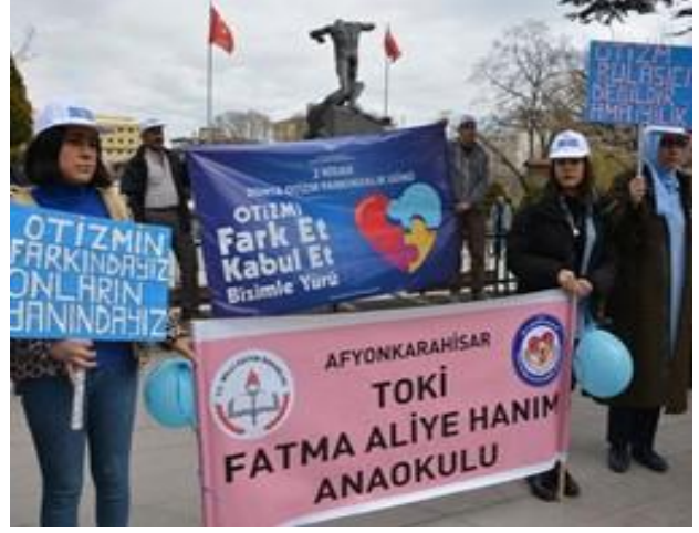
Afyonkarahisar'da farkındalık yürüyüşü yapıldı