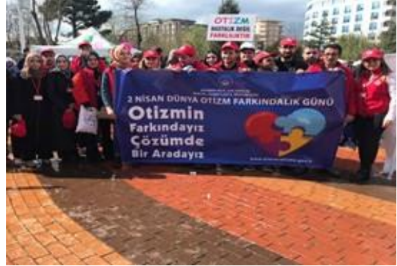
Batman otizm için yürüdü