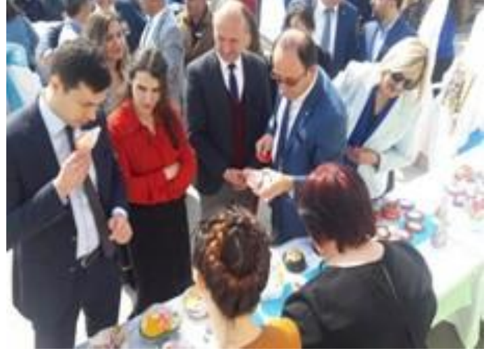
İl protokolünün katılımıyla yürüyüş ve el sanatları etkinlikleri yapıldı