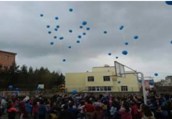
Gökyüzüne mavi balonlar bırakıldı