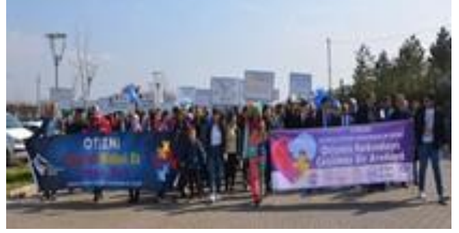
Karabük Üniversitesi kampüsünde farkındalık yürüyüşü gerçekleştirildi