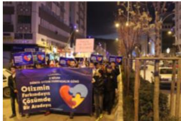
Çankırı halkı otizm farkındalığı için yürüdü