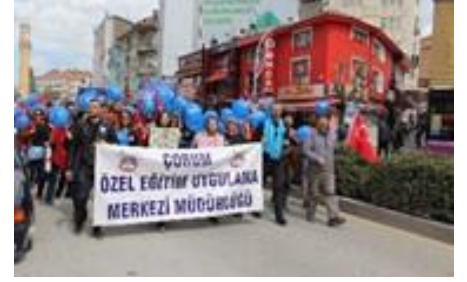
Çorum halkı otizme dikkat çekti