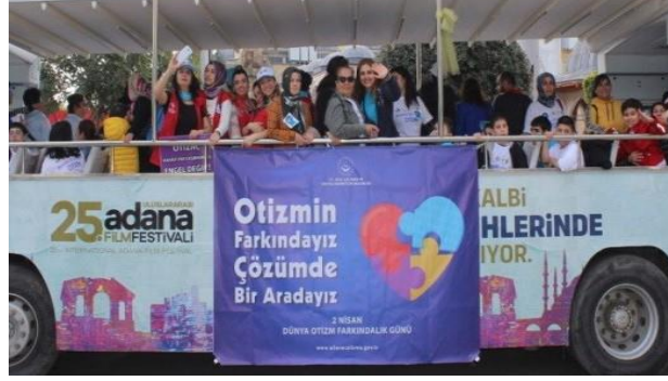
Açık otobüsle şehir turu farkındalık etkinliği yapıldı