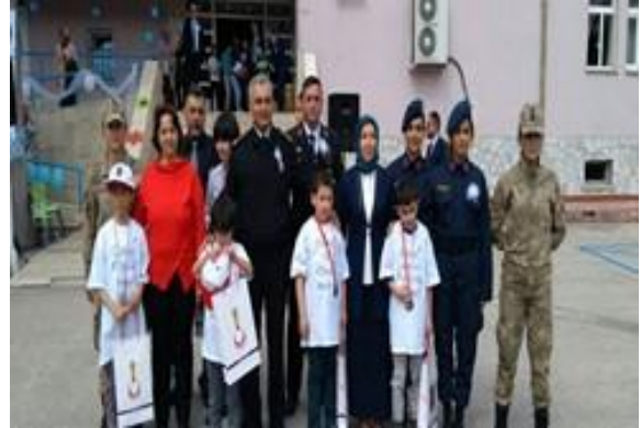
Amasya Valiliği önderliğinde kamu kurumlarının iş birliği ile gerçekleştirilen farkındalık etkinliği Lokman Hekim İşitme Engelliler Okulu