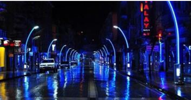
Cumhuriyet Caddesi mavi ışıkla aydınlatıldı