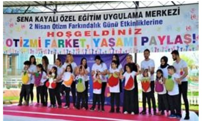
İl Milli Eğitim Müdürlüğü ve İl Müdürlüğümüz iş birliğinde özel eğitim uygulama okulunda program düzenlendi