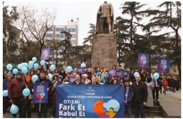
Kamu kurumları temsilcileri, STK'lar ve halkın katılımıyla farkındalık yürüyüşü düzenlendi