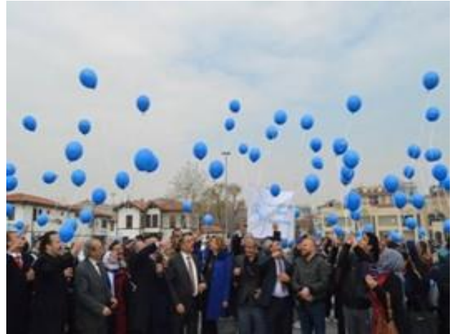
İl merkezinde protokolün katılımıyla farkındalık yürüyüşü ve mavi balon etkinliği yapıldı