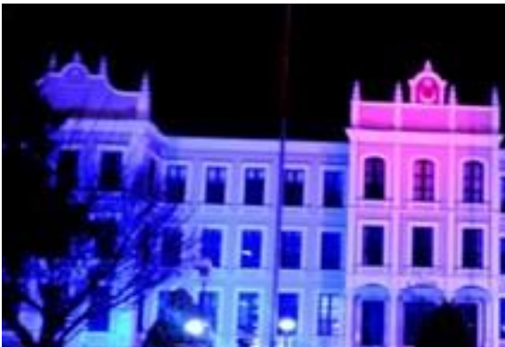
Valilik binası mavi ışıklandırıldı