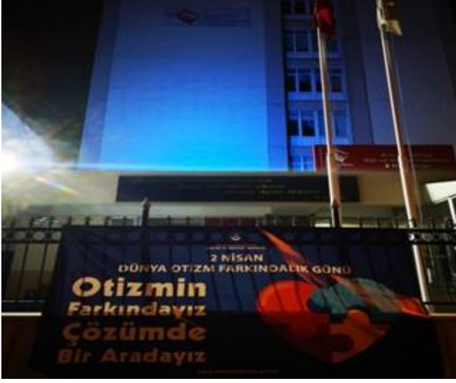
İl Müdürlüğü binamız mavi ışıklandırıldı