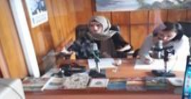
Radyoda bilgilendirme yayınları yapıldı