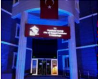
İl Müdürlüğü binamızda mavi ışıklandırma yapıldı