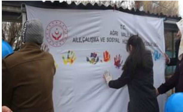
Otizm gönüllüleri el verdi