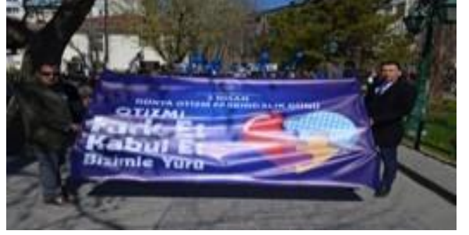
İlde farkındalık yürüyüőü yapıldı ve İl Müdürlüğümüzde bilgilendirme standı açıldı