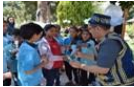
Farkındalık yürüyüşü ve halkoyunları gösterilerinin ardından Denizli protokolü çocuklarla birlikte ağaç dikme etkinliğine katıldı