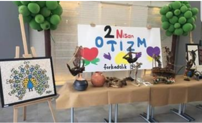
Farkındalık sergisi düzenlenerek el ürünleri sergilendi