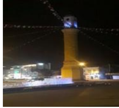
Valilik Binası ve Saat Kulesi mavi ışıklandırıldı