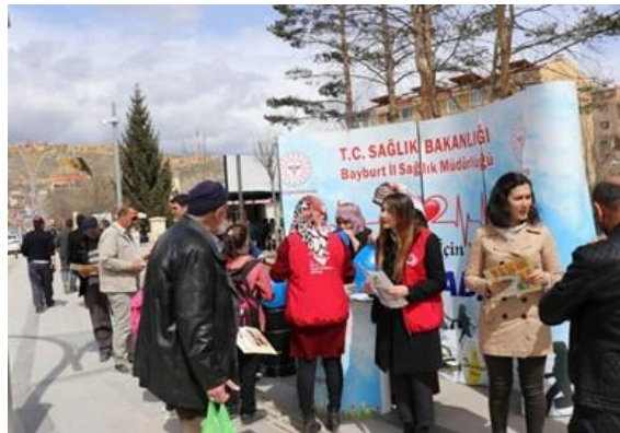
Bayburt İl Sağlık Müdürlüğü Otizm bilgilendirme standı