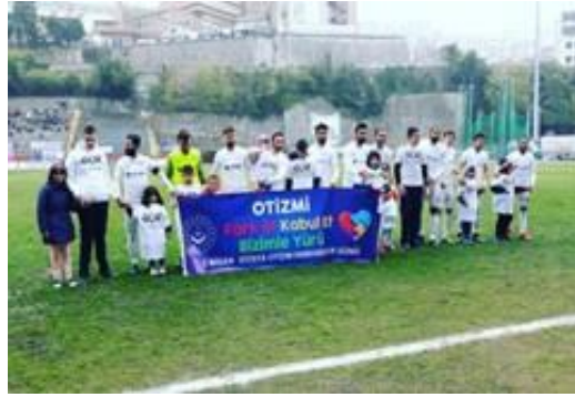
Zonguldak Karaelmas Stadyumunda oynanan Kömürspor-Sivas Belediyespor müsabakasında futbolcular otizmli bireylerle birlikte otizm farkındalık pankartı ile sahaya çıktı