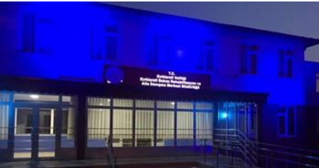
Kırklareli Bakım Rehabilitasyon ve Aile Danışma Merkezi mavi ışıklandırıldı