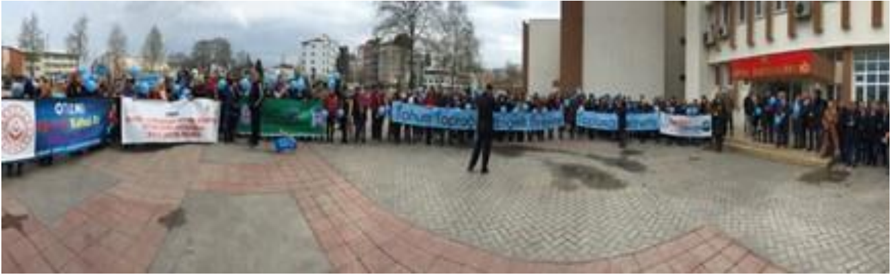
Kent meydanında ve Fatsa İlçesinde farkındalık yürüyüşü yapıldı