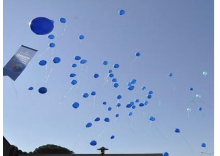
Mavi balonlar gökyüzüne bırakıldı