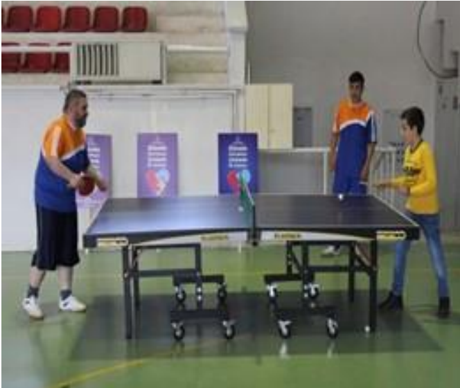
Otizme dikkat çekmek için spor müsabakaları yapıldı