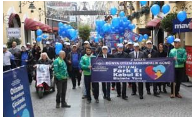
İl Protokolü öncülüğünde farkındalık yürüyüşü gerçekleştirildi