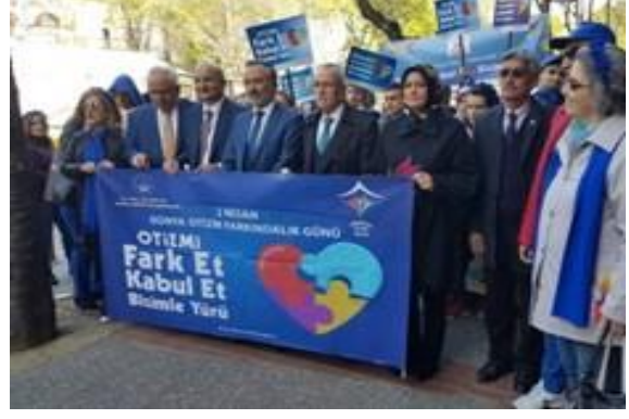
İl protokolü otizm için yürüdü