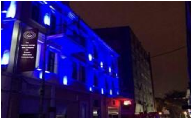
İl Müdürlüğü binamız maviye büründü