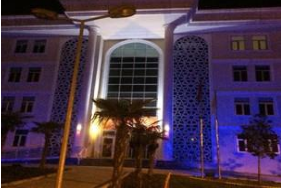
İl Müdürlüğü binamız maviye büründü