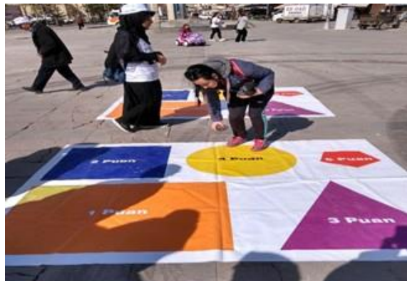
Karaman İl Sağlık Müdürlüğü Açık ve kapalı oyun alanlarında çocuklar ve aileleriyle etkinlikler