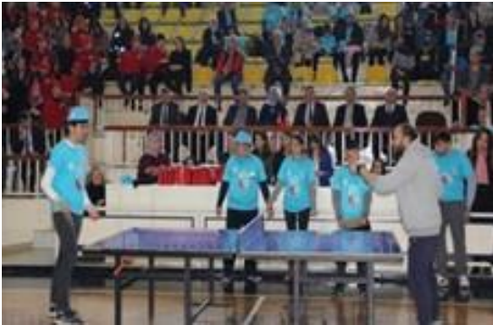
Spor müsabakaları ile farkındalık sağlandı