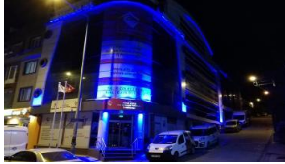
İl Müdürlüğü binamız maviye büründü