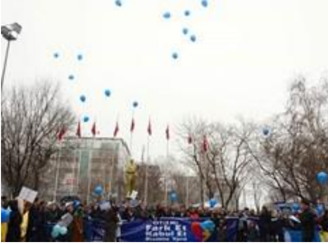
Mavi balonlar umut için gökyüzüne bırakıldı