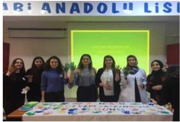
Düzce İl Sağlık Müdürlüğü Sağlık personelimiz tarafından liseli öğrencilere yönelik Otizm farkındalık semineri