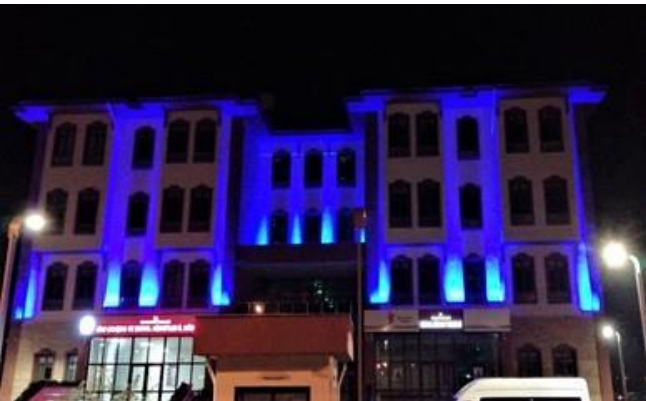
İl Müdürlüğü binamız mavi ışıklandırıldı