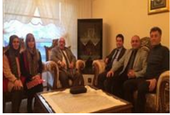
Bayburt İl Sağlık Müdürlüğü İl Müdürü ve personeli ile aile ziyaretleri