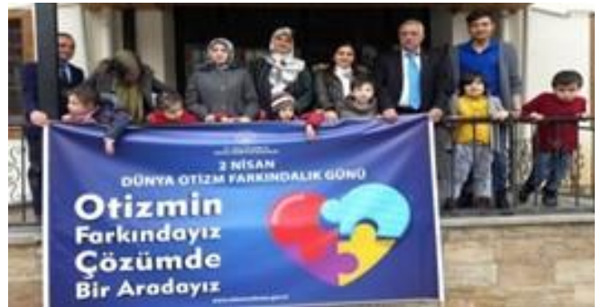
Otizimli bireye sahip aileler, otizme dikkat çekti