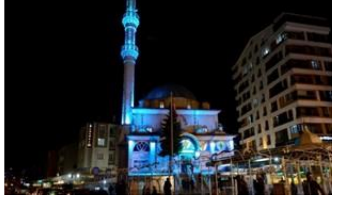
İlin simgesi "Vazo" ve Laleli Cami mavi ışıklandırıldı