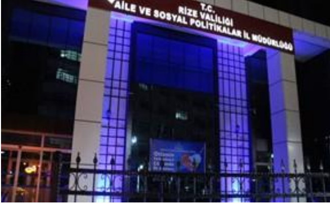
İl Müdürlüğü binamız maviye büründü