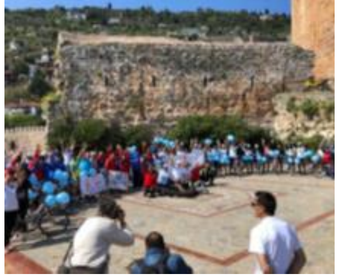
Bisiklet turu ve mavi balon etkinlikleri ile farkındalık sağlandı