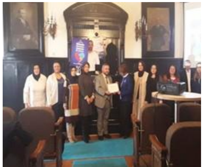
Otizimli çocukların ve ailelerinin katılımıyla eski TBMM binası, müze gezisi gerçekleştirildi