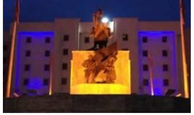
Valilik binası mavi ışıklandırıldı