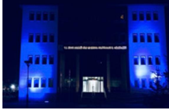
İl Müdürlüğü binamız mavi ışıklandırıldı