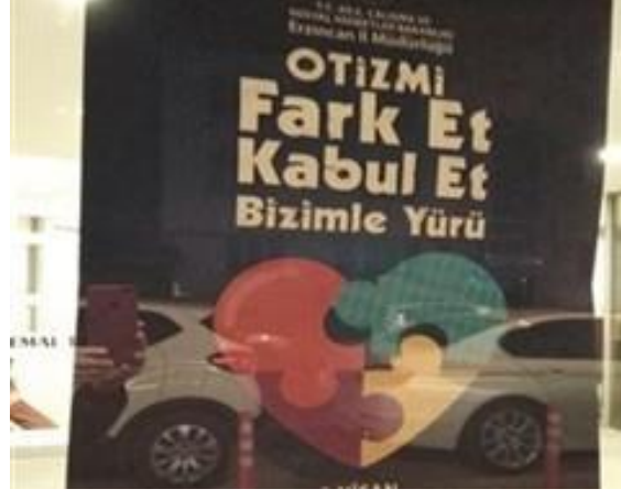
İl Müdürlüğü binamız mavi ışıklandırıldı