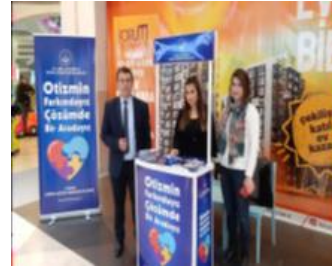
AVM'lerde bilgilendirme stantları kuruldu