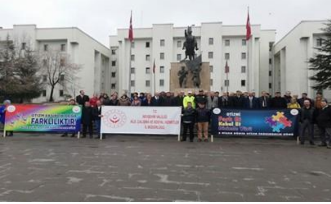
Farkındalık yürüyüşü yapıldı