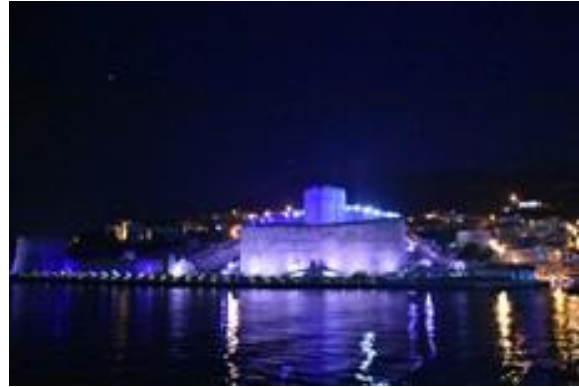
Çanakkale Kaleleri mavi ışıkla aydınlatıldı