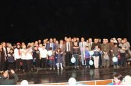
İl Müdürlüğümüz ve İl Milli Eğitim Müdürlüğü iş birliğinde özel eğitim uygulama okulunda tiyatro gösterisi düzenlendi