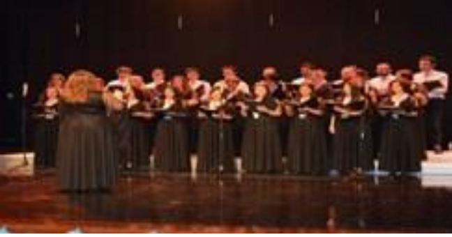
Eskiőehir polifonik korusu konseri ile otizme dikkat çekildi