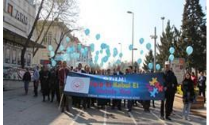
Farkındalık yürüyüşü yapılarak mavi balonlar gökyüzüne bırakıldı