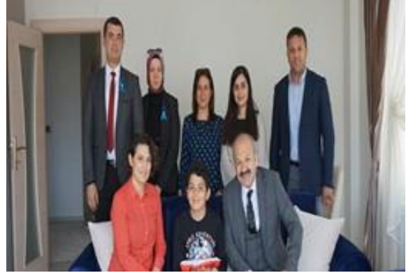
Uşak İl Sağlık Müdürlüğü 1- Farkındalık Yürüyüşü 2- İl Sağlık Müdürü tarafından aile ziyareti