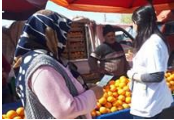
Karaman İl Sağlık Müdürlüğü Sağlık personelimiz tarafından halka yönelik bilgilendirme