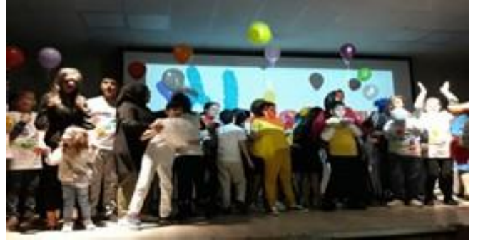
İl protokolünün katılımıyla çocuklara yönelik eğlence etkinlikleri yapıldı