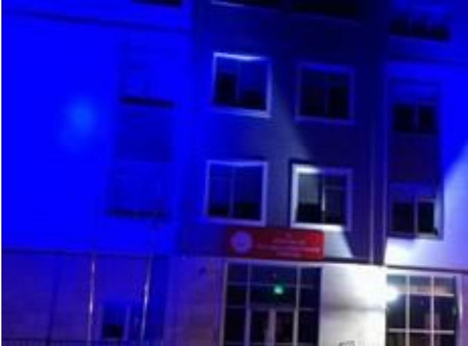
İl Müdürlüğü binamız mavi ışıkla aydınlatıldı