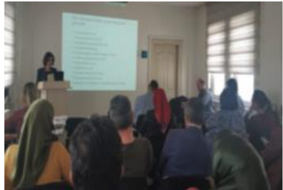
Bolu İl Sağlık Müdürlüğü 1. Ailelere Yönelik Otizm Farkındalık Semineri 2. Sağlık Personeline Yönelik Otizm Farkındalık Eğitimi