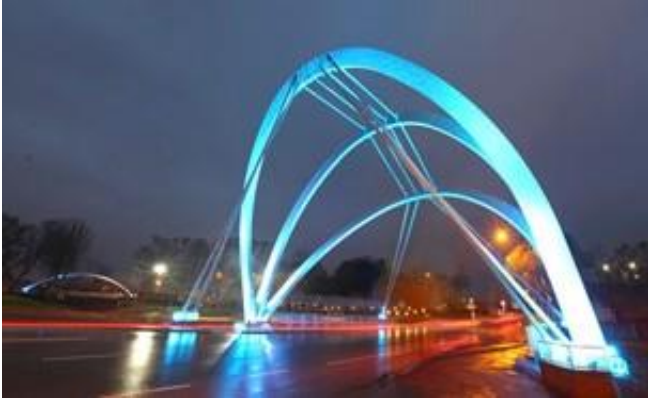
Mavi ışıklandırma yapıldı