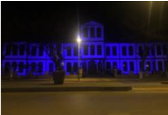
Çankırı Müzesi maviye büründü