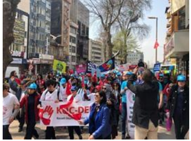
"Mavi Giy Kocaeli" sloganıyla Protokolün ve Büyükşehir Belediyesi bando takımının katılımıyla kent meydanında farkındalık yürüyüşü yapıldı