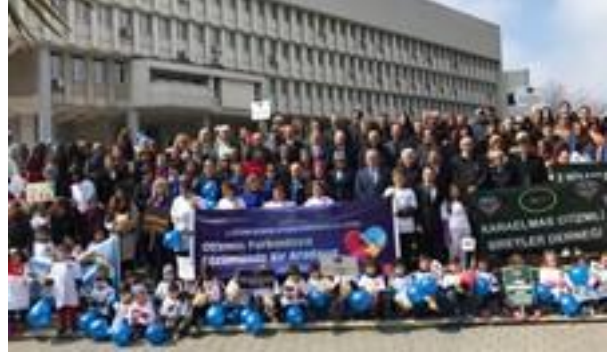
Farkındalık yürüyüşü gerçekleştirildi