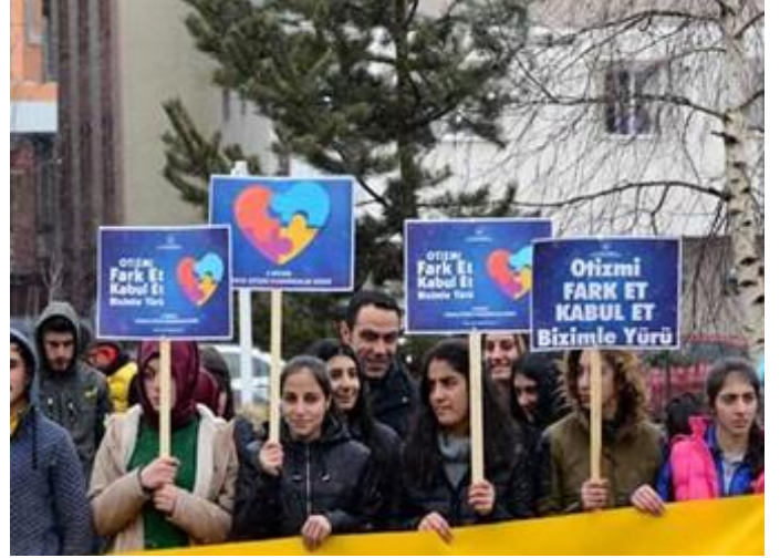
Farkındalık yürüyüşü yapıldı