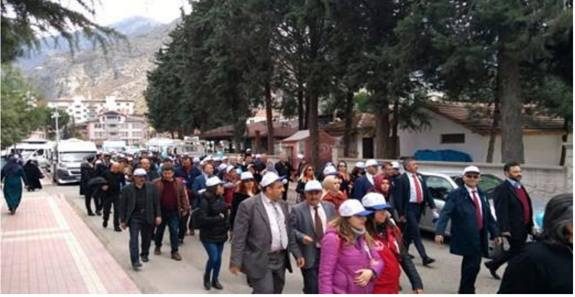
Amasya İl Sağlık Müdürlüğü Farkındalık Yürüyüşü