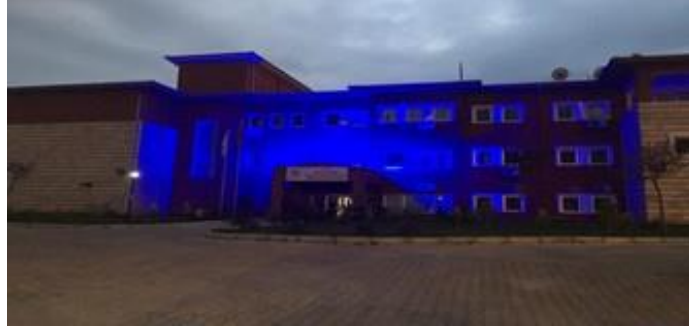
İl Müdürlüğü binamız mavi ışklandırıldı