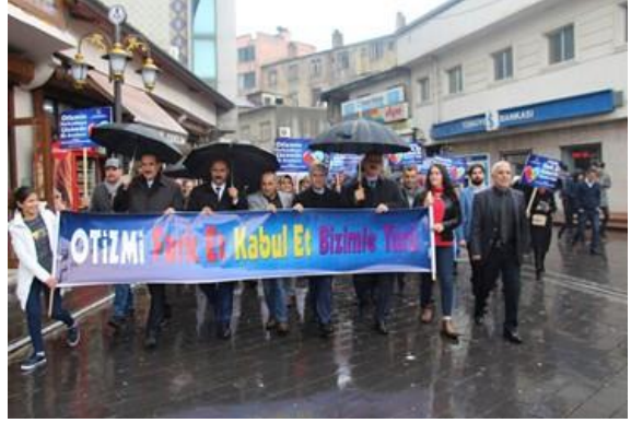
İl protokolü otizm yürüyüşünde