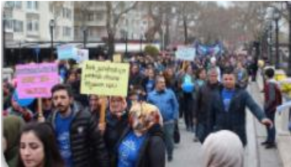
Kurum müdürlülerinin katılımıyla Cumhuriyet Meydanında farkındalık yürüyüşü yapıldı, gökyüzüne mavi balonlar bırakıldı