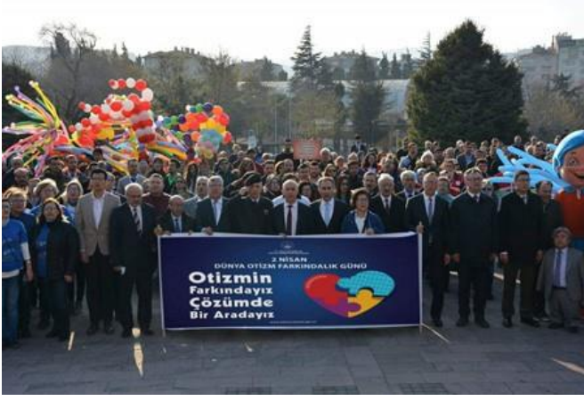
İl protokolü otizm için yürüdü