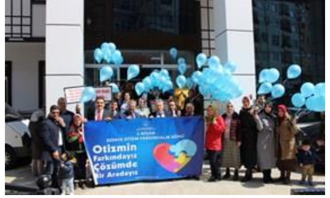
İl Müdürlüğümüz yöneticileri, personeli ve ilkokul öğrencileri ile mavi balon etkinliği düzenlendi