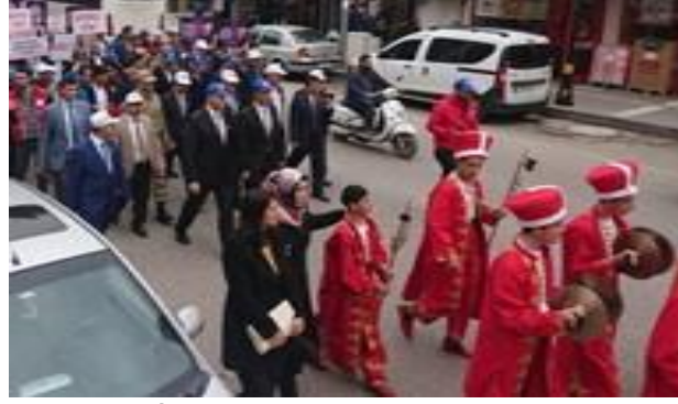
İl protokolü otizm için yürüdü