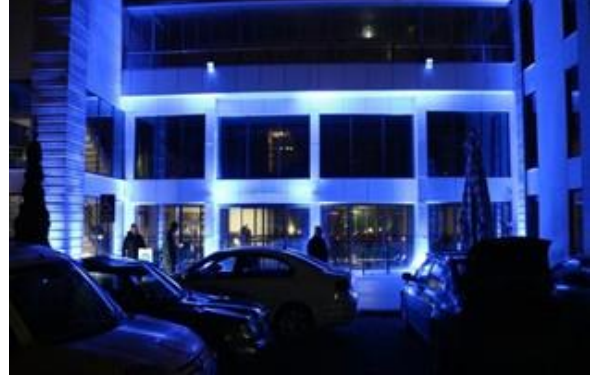
Varlıbaş AVM ve Köşk Huzurevi mavi ışıklandırıldı